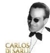
El Tuerto, Di Sarli, el sentimiento milongero

Par ailleurs, un cours spécial débutants sera donné le dimanche 6 novembre