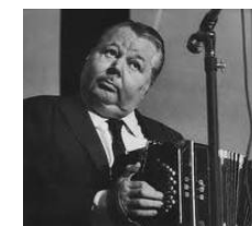
Troilo, el gran Desconocido

Moments de pause et mouvements sur la mélodie