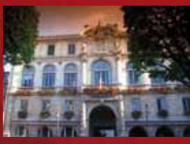
Hôtel de ville de Pau