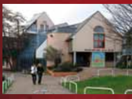
La MJC du Lau